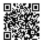
携帯サイト QR コード