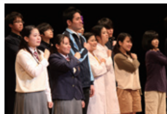
昨年度（兵庫県開催）の様子

今年度は東京都において、パネルディスカッションや演劇を通してハンセン病やエイズなどに対する正しい理解を深め、差別や偏見なく全ての人が「共に生きる」より良い社会づくりに貢献することを目的として、「第17回ハンセン病問題に関するシンポジウム～人権フォーラム2018in東京～」を開催します。