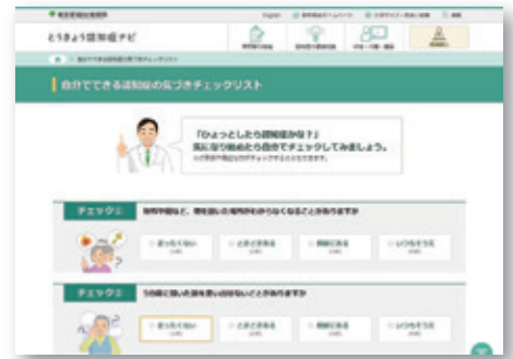
「自分でできる認知症の気づきチェックリスト」画面イメージ

「認知症について相談したいときはどこに行けばいいの?」、「認知症に関する専門知識を身に付けたいときはどんな研修があるの?」などを調べたい時に、対象別・目的別のメニューやよく検索されるワードから検索できるなど、必要な情報を探しやすくしています。