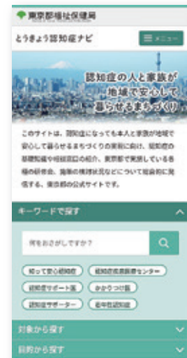
スマートフォン版画面イメージ

「虐待かも…」、「このままでは虐待になってしまうかも…」と感じたとき、通報・相談できる窓口をご案内しています。