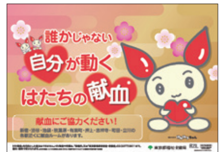
平成29年度献血キャンペーンポスター

東京都赤十字血液センターでは、「携帯メールクラブ」の新規会員を募集しています。詳細は、下記のホームページ等をご覧ください。