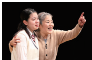
演劇「光の扉を開けて」

ハンセン病に対する偏見・差別を解消し、ハンセン病元患者の名誉回復を図るため、平成16年度から厚生労働省が主体となり、ハンセン病問題に関する正しい知識の普及啓発として、ハンセン病問題に関するシンポジウムが開催されています。